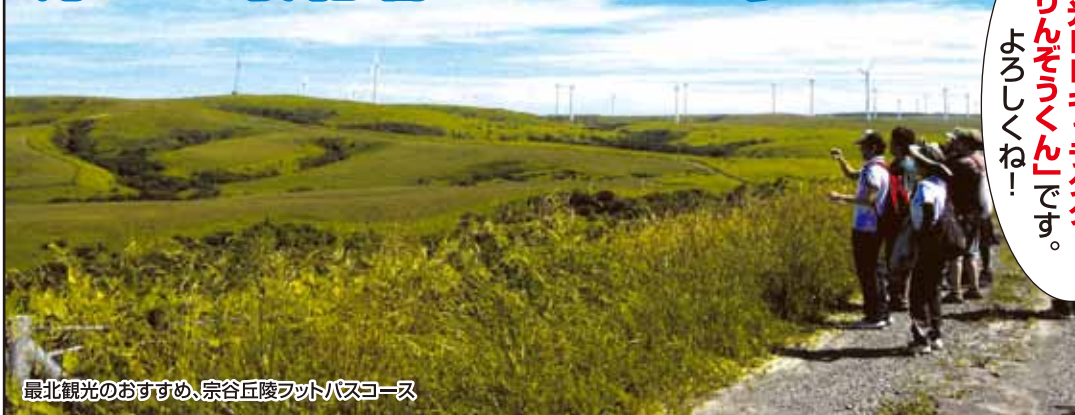
最北観光のおすすめ、宗谷丘陵ワットバスコース