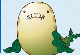
稚内観光PRキャラクター「出汁之介」

EVENT 稚内サハリン館 ●24年2月1日～3月15日 国境の街稚内でロシア民謡アンサンブルをお楽しみください。