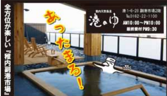
全方位が楽しい「稚内副港市場」